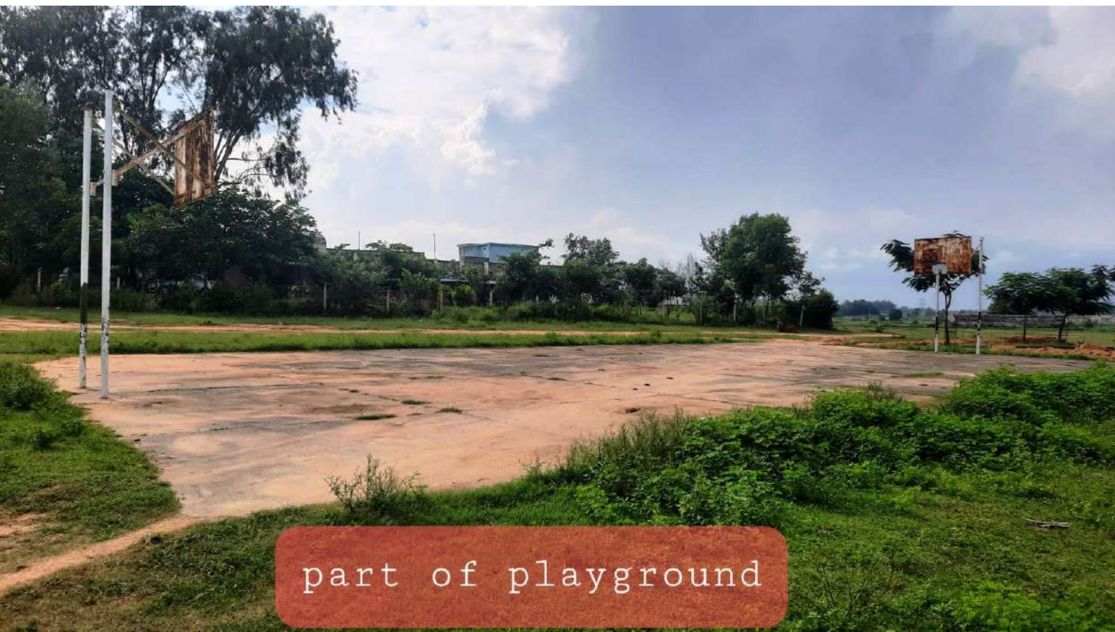
part of playground