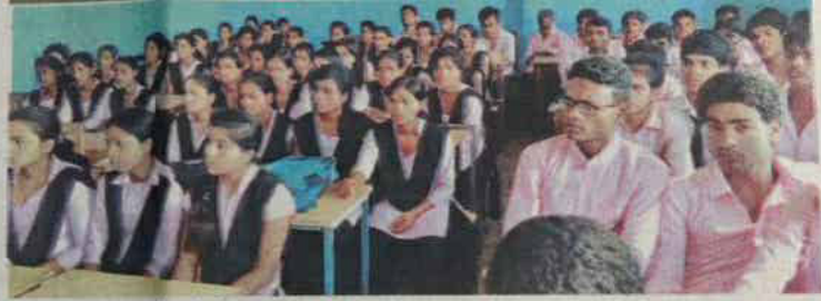
मानवाधिकार दिवस कार्यक्रम के दौरान उपस्थित छात्र-छात्राएं।

महिलाओं व दिव्यांगों को राजनीतिक निर्णय लेने प्रोत्साहित भी किया गया