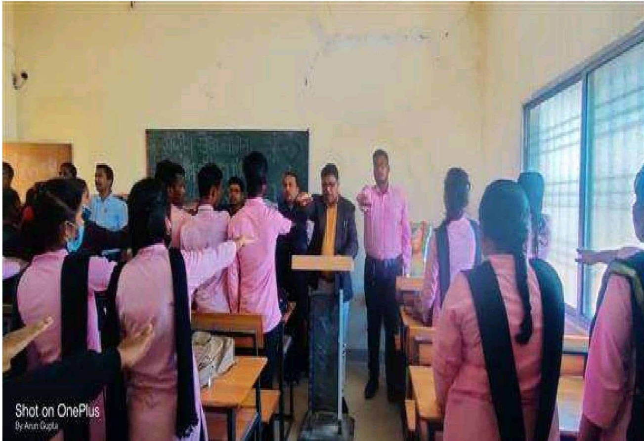
OATH TAKING ON CONSTITUTION DAY