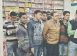
व्यापारिक प्रतिष्ठानों में कैशलेस की जानकारी देने और

नगर संवर्धन। राजमपुर के लिए आ बैंको में जम है। इसके अ लेन-देन के कैशलेस के ई-वापसदे